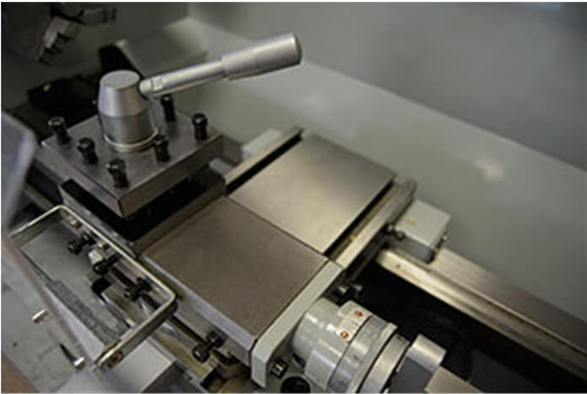
Расстояние между центрами пазов -115мм.