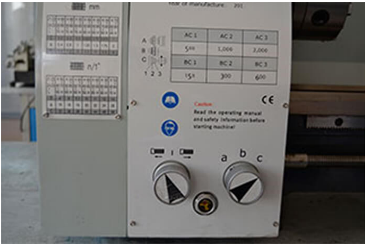
Коробка подачи для регулировки шага при нарезании резьб.