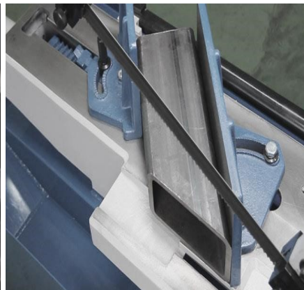
ПРОКАТ РАЗЛИЧНОЙ ФОРМЫ