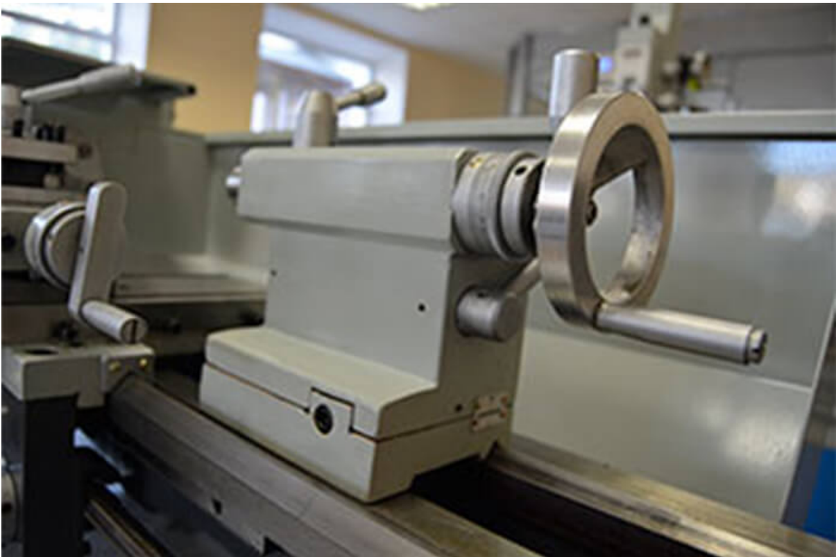
Массивная задняя бабка с основанием 150мм и быстрым зажимом.