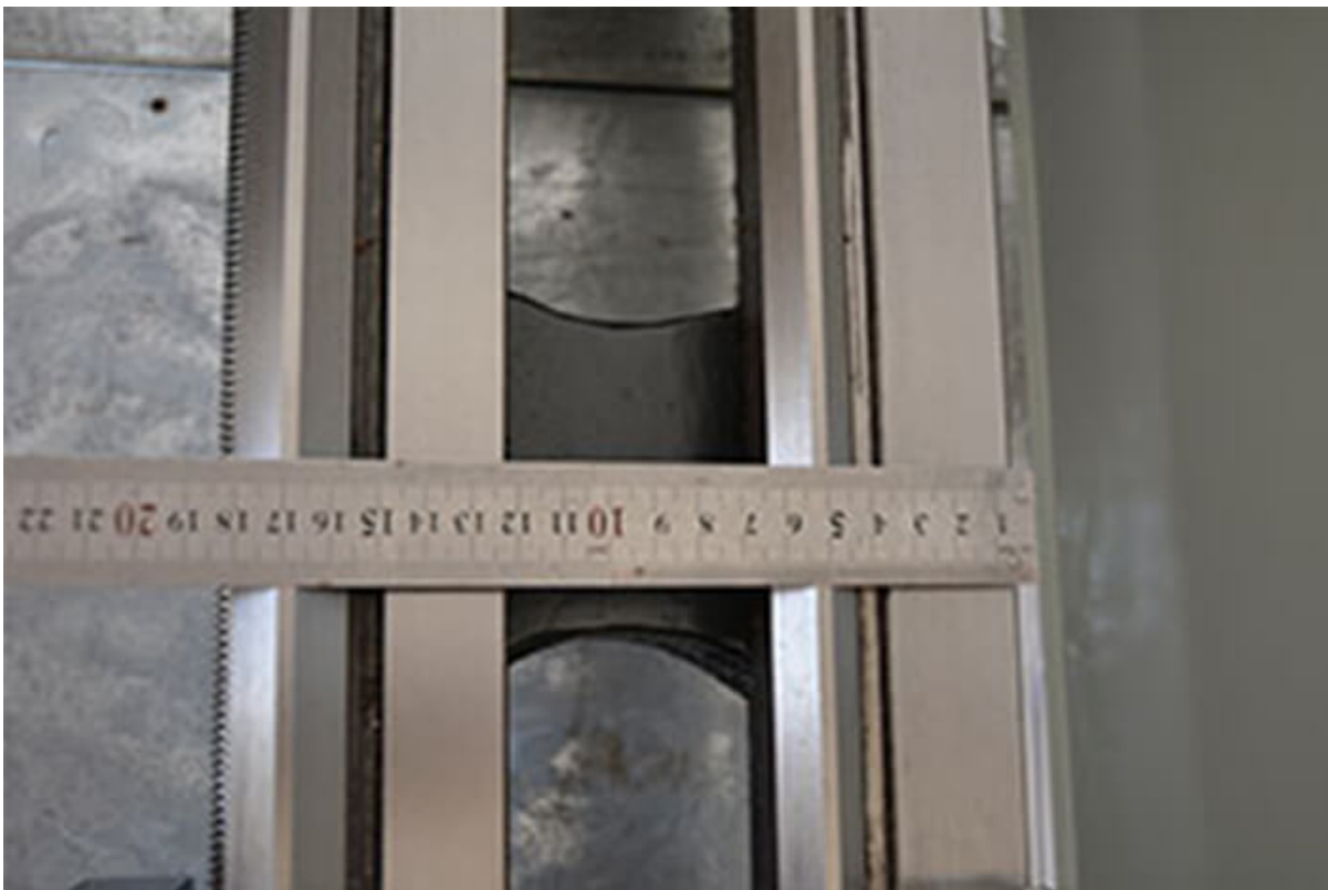
Закаленная станина шириной 180 мм