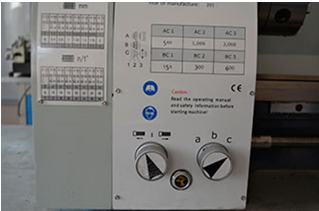
Коробка подачи для регулировки шага при нарезании резьб.