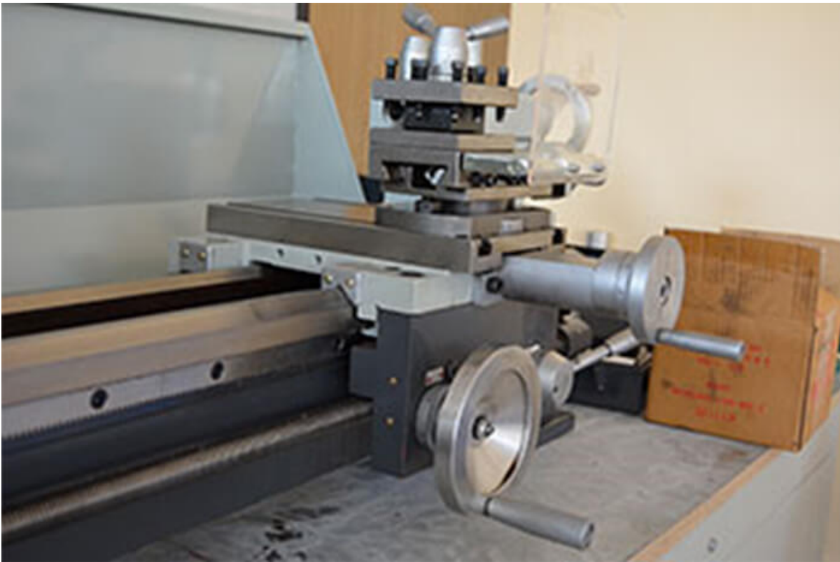
Металлические маховики продольной и поперечной подачи.