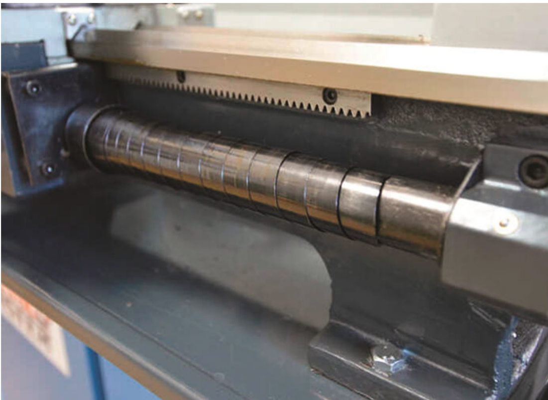
Телескопическая защита ходового винта от стружки эффективно защищает ходовой винт от износа.