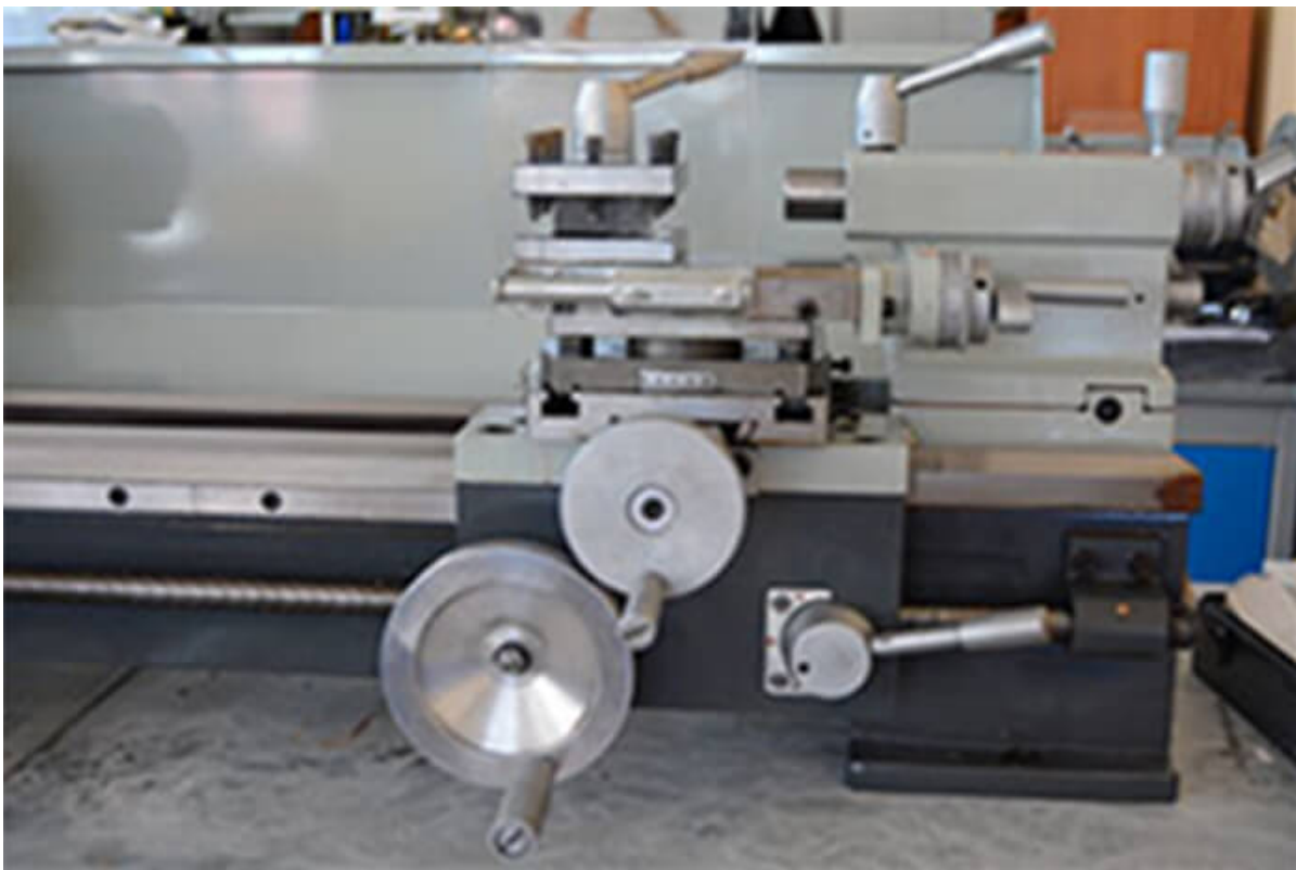
Усиленный суппорт шириной 150мм и Т-пазами