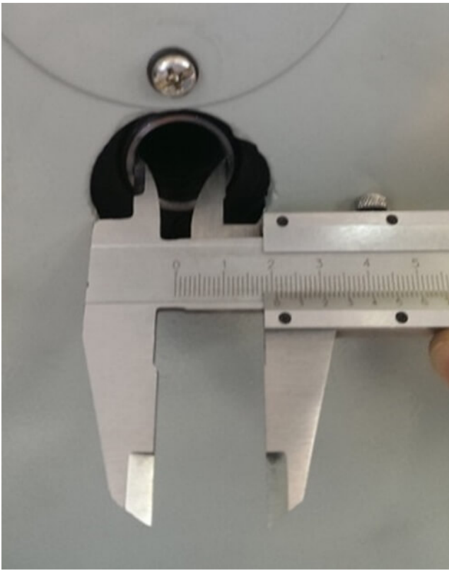
Диаметр сквозного отверстия в шпинделе 21мм