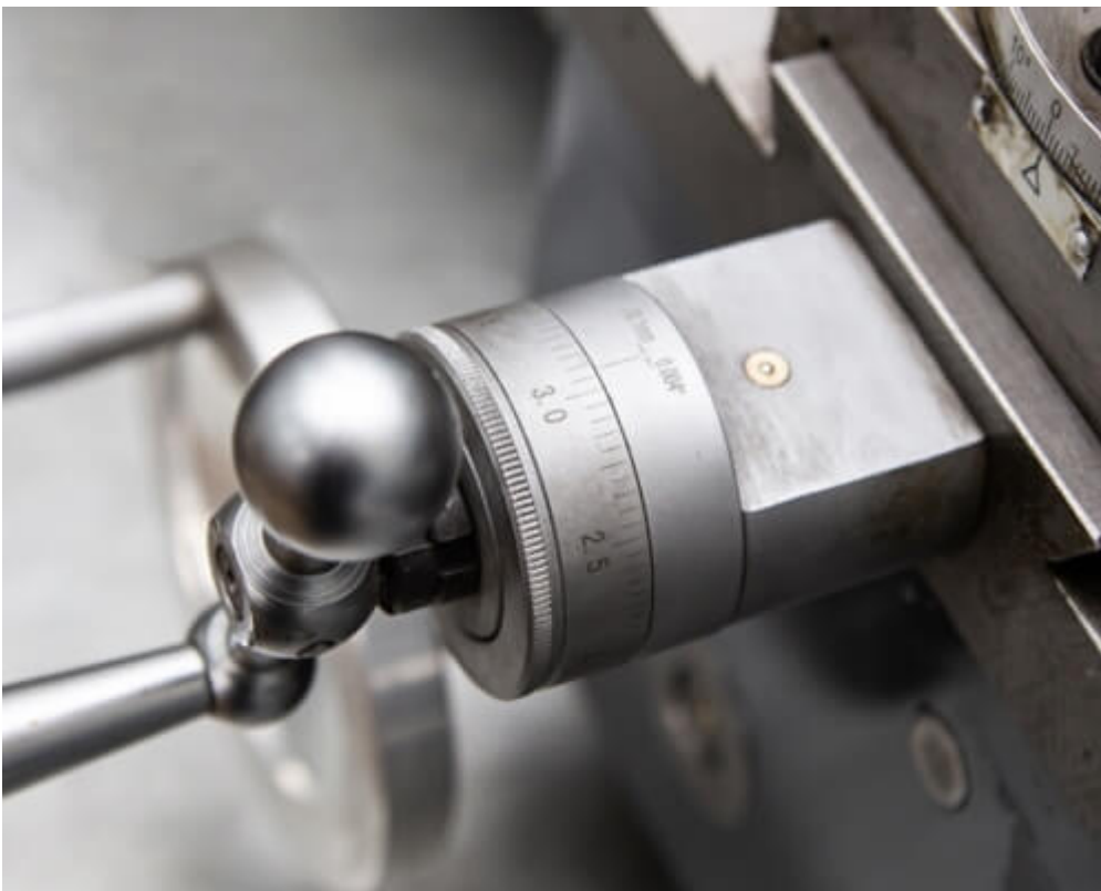
Цена деления лимба поперечной подачи – 0,1мм.