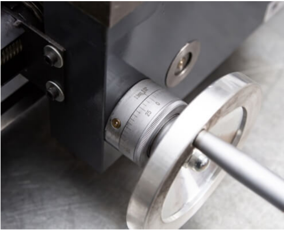
Цена деления лимба продольной подачи - 0.5 мм