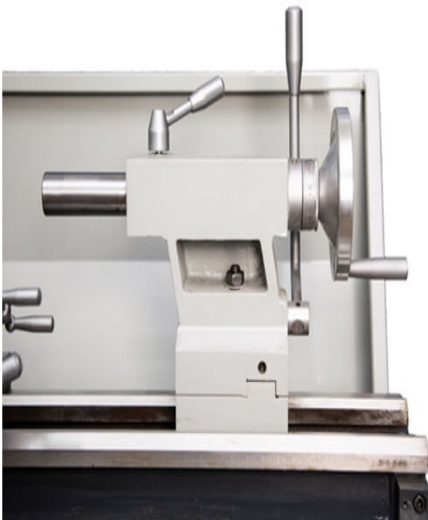
Вылет пиноли задней бабки составляет 80 мм