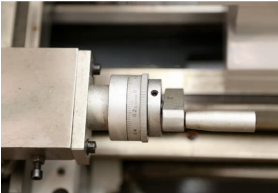
Цена деления лимба тонкой продольной подачи - 0.02 мм