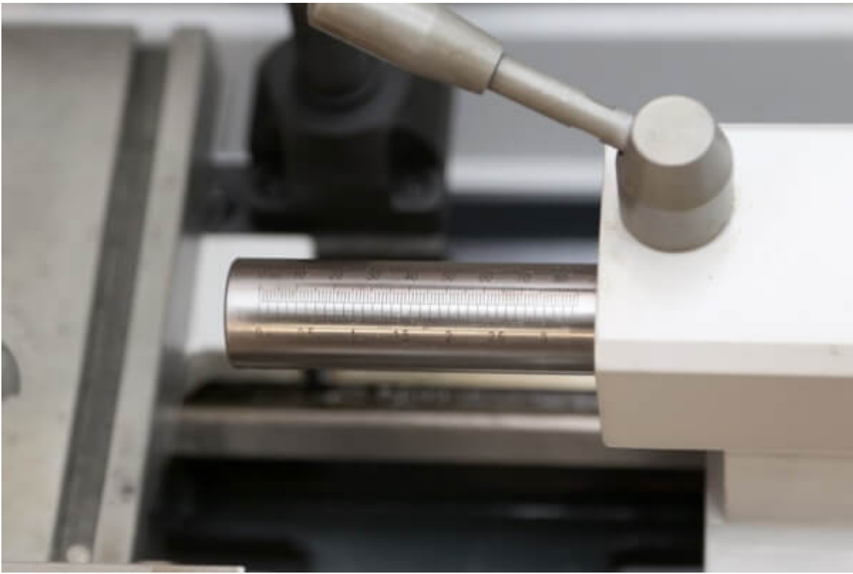
Вылет пиноли задней бабки 60 мм