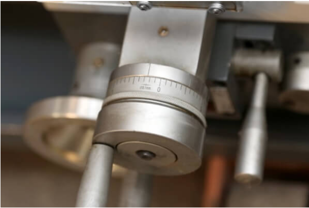
Цена деления лимба поперечной подачи – 0,1мм.